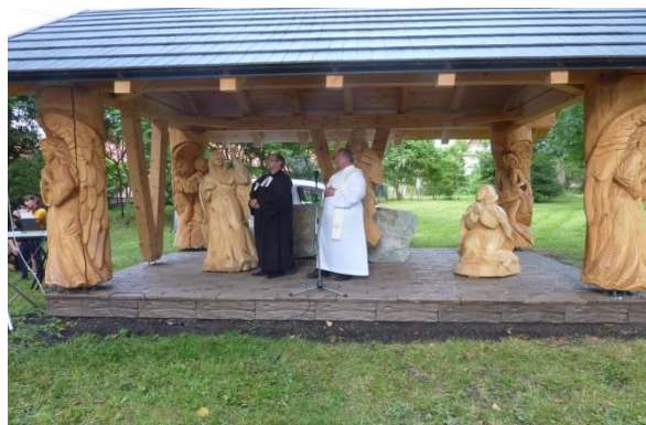
Snímka: Kaplnku posvätili miestni duchovní.

diel nie je len vonkajšia krása, ale snaha ponúknuť ľuďom príležitosť trochu sa stíšiť a zastaviť v dnešnej uponáhľanej dobe, aby i srdce mohlo pozdvihnúť vnútorný zrak človeka k nebu. Z toho dôvodu sa obec rozhodla altánok posvätiť. Kaplnka bola posvätená pri ekumenickej pobožnosti v nedeľu 6.9.2020. Bohoslužby sa zúčastnilo asi 120 občanov. Na akcii sa podieľali a výborný guláš navarili Ďanovčania.