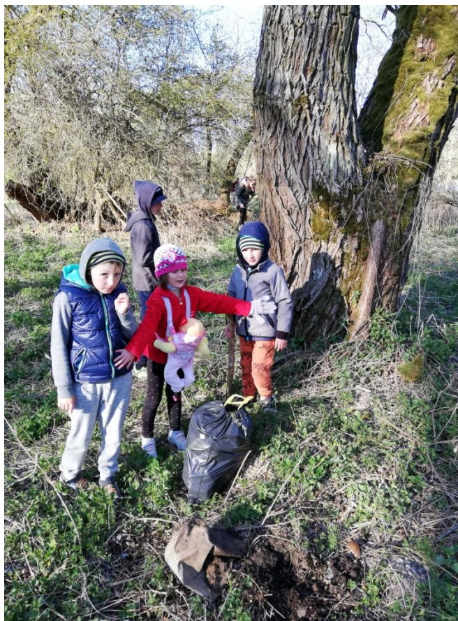
Snímky: Tunajšia príroda očami návštevníkov.

a Nemecka. Našli to tu podľa aplikácie, v ktorej zdieľajú pekné miesta. Turista z českého Trínca uviedol, že je to jedna z mála lokalít, kde je čistá príroda.