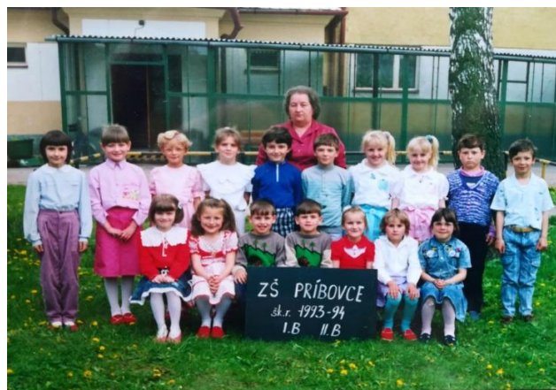
Snímka: 1. a 2. r. ZŠ Príbovce v Ďanovej v šk. r. 1993/94.

Pani učiteľku som listom poprosil, či nám môže niečo prezradiť o svojom učiteľskom živote, čo ju priviedlo k učiteľskému povolaniu a ako sa ocitla v Ďanovej, koľko detí za tie roky odhadom učila, ako si získala priazeň svojich žiakov, či dávala žiakom aj „prasiatka“, či mala niekedy s rodičmi detí nezhody a ako vidí dnešných učiteľov. Keď som si prišiel po odpoveď, pani učiteľka sa mi prihovarila z okna a vyjadrila potešenie, že sme si na ňu spomenuli a vraj sa už teší na „noviny“. Vo svojom liste nám napísala: