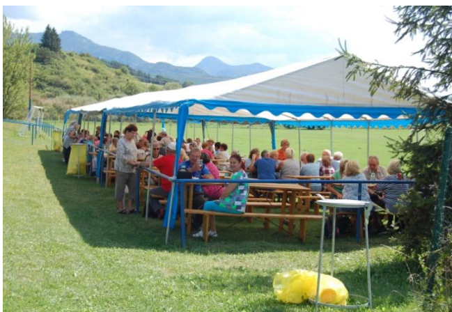
Snímky: O turistiku v okolí rybníka a posedenie pri guláši bol veľký záujem.