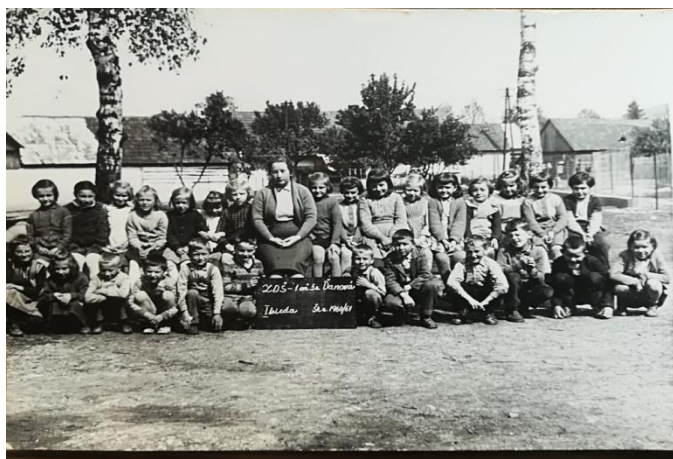
Snímka: 1. ročník ZDŠ Ďanová v školskom roku 1960/61.