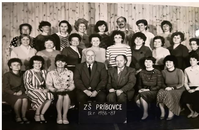
Snímka: Učiteľský zbor ZŠ Príbovce v roku 1987.

Keď spomínam na uplynulé roky, som šťastná, že som mala dobrých žiakov a spokojných rodičov. Teší ma, ak v dobrom spomínajú na svoju prvú učiteľku.“