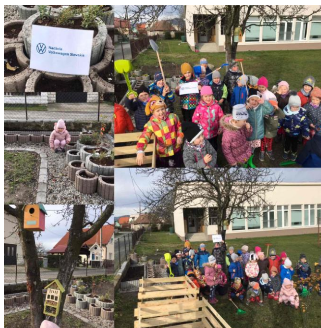
Snímka: MŠ vlani uspela v projekte B10 záhradka a z nadácie Volkswagen dostala na jej vybudovanie 1.000€.