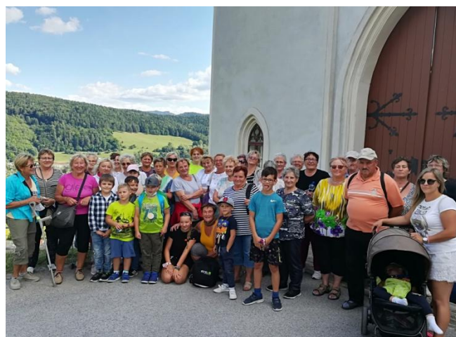
Snímka: Pri spiatocnej ceste výletníci navštívili hrad v Slovenskej Ľupči.

Jednou z posledných príležitostí na letný výlet bol autobusový zájazd na Horehronie a Podpoľanie 27.8.2020. Hrštka občanov Ďanovej zareagovala na ponuku občianskeho združenia Nádej človeka z Príbovíc a na konci prázdnin sme sa vybrali na výlet. Previezli sme sa Čiernohronskou železnicou do Lesníckeho skanzenu Vydrovo, navštívili sme hrad v Slovenskej Ľupči a stredoveký kostol v Ponikách. Výletu sa okrem dospelých a starších zúčastnilo aj mnoho detí. Výletníci sa zhodli, že išlo asi o posledný výlet, keďže sa očakávala druhá vlna Covidu.