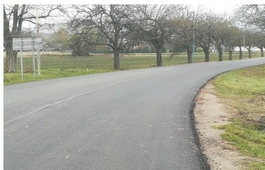
Snímka: Nový asfaltový koberec od agáta po začiatok obce.