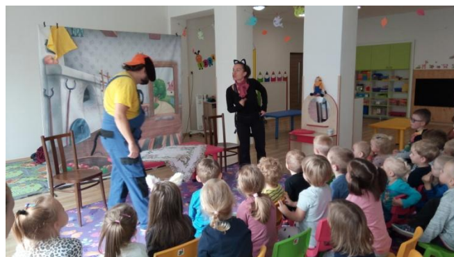
Snímka: Vo februári deti v škôlke privítali bábkové divadlo zo Žiliny s rozprávkou o psíčkovi a mačičke.

Škôlku v súčasnosti navštevuje 37 detí, čo je aj maximálna kapacita dvoch tried. Vekovo mladšiu triedu navštevuje 18 detí, do staršej triedy chodí 19 detí, z nich je 9 detí v predškolskom veku. MŠ funguje v režime prísnych protiepidemických opatrení.