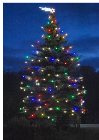
Snímka: Vianočne vyzdobený strom P. Šimu.

Milí čitatelia, prajeme Vám pokojné a požehnané Vianoce, nech nás v zdraví a v kruhu najbližších v novom roku stretnú lepšie časy.