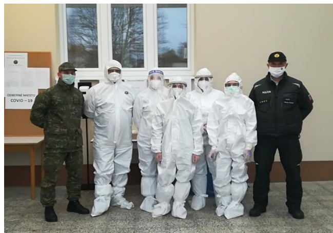
Snímka: Odberový tím počas 1. a 2. plošného testovania.