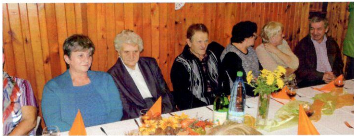
Na stretnutí s jubilantmi panovala príjemná atmosféra.

sa máme radi. Čas plynie ako rieka nášho života. Míňa sa deň za dňom, rok za rokom - nedá sa tomu vyhnúť. Úcta k starším by mala byť spontánna a sústavná, veď starší ľudia si ju zaslúžia. Výbor ZOJDS v Ďanovej vám všetkým praje pevné zdravie, veselú myseľ, veľa úsmevu, elánu a radosti zo života. Nech je vaša jeseň života plná farieb, z ktorých každá bude znamenať jedno prežité obdobie života.