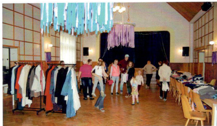
Susedská burza bola naozaj pestrá – tovarom i občerstvením.

plackách, pečených zemiakoch so slaninou a cibuľou, šúľancoch s makom a zemiakovom bifteku na hriankach a dvoch druhoch miestneho piva. Ďakujeme šikovným gazdinkám za prípravu všakovakých dobrôt a všetkým zúčastneným za príjemne prežité popoludnie či prejavený záujem o núdznych. Vrečia určené na charitu neboli plné len šatstvom, ale i inými potrebami ako drogéria, hygienické potreby, sladkosti či hračky. Priniesli ste nielen to, čo už doma nepotrebuje, ale darovali ste i úplne nový a nepoužitý tovar. Ďakujeme vám za to.