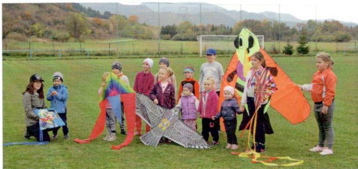
Tento rok to deťom so šarkanmi naozaj vyšlo.