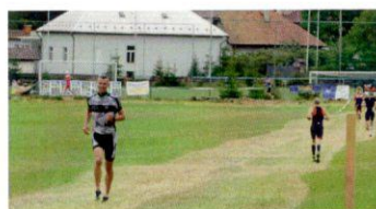
Bežecká časť TAT