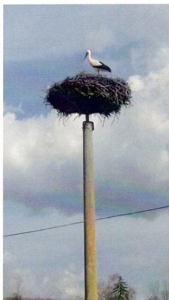
Bocian v tomto roku priletel 1. apríla