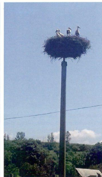
V júli už vykukali štyri mladé bociany