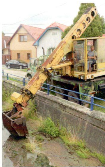
Potoky v obci sú plné odpadu, ktorý tam hádžu ľudia. Hrádze na odvodňovanie zasypeme trávou...