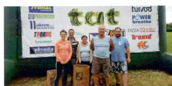
Občerstvenie počas triatlonu „nesúťažne“ zabezpečila obec