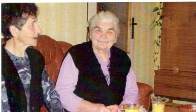
Naším jubilantkám želáme, aby ešte v obstojnom zdraví boli dlho medzi nami.