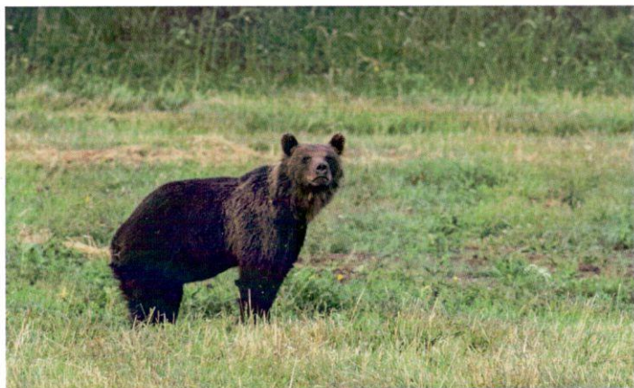
Macka naši občania videli v okolí Borín, pri ceste smerom na Folkušovú, na okolitých pašienkach a pri brezových hájoch.