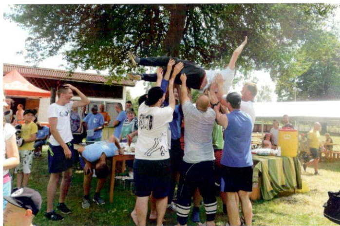
Deti a športovci sa dovesela vyšantili...