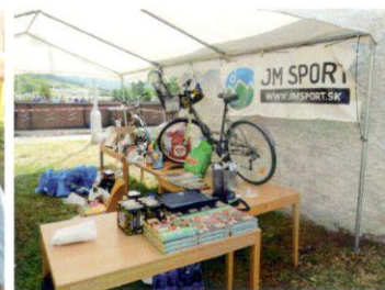
Na svoje si prišli aj starší...