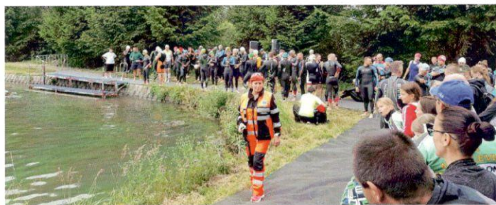
Účastníci TAT pred štartom