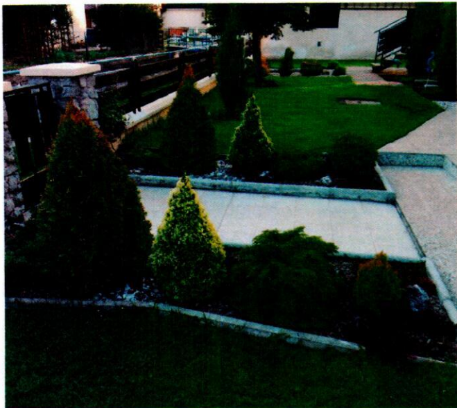
Vkusne zladené prostredie okolo domu – predzáhradka rod. Ďanovskej.