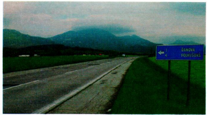
Cesta, po ktorej stále jazdíme, bola postavená v r. 1969. Odvtedy sa prakticky nezmenila.