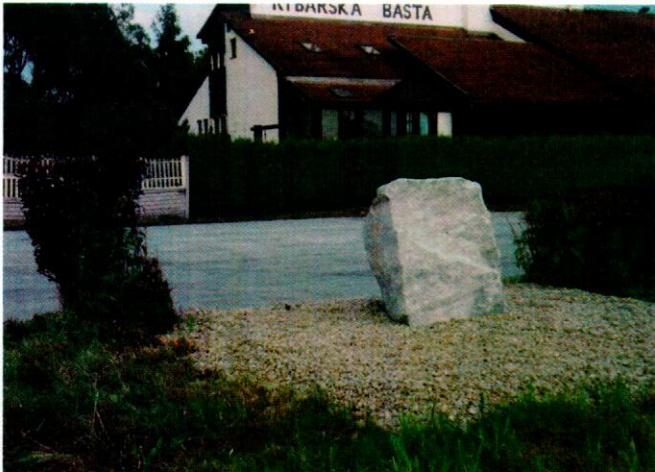
Základný kameň novej cesty 1/65.

Text a foto: M. Taraba, A. Š. Pakánová ■