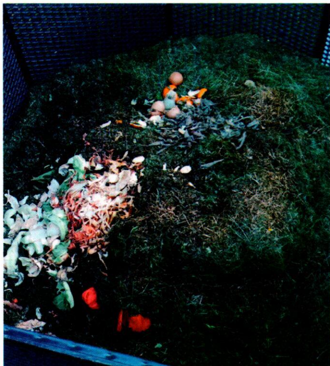
Správny spôsob nakladania s bio odpadom.

V poslednom období sme vás zaplavili množstvom informácií ako opätovne zhodnotiť to, čo sa prirodzene rozloží v zemi, či dať plastom druhú šancu. Skôr ako sa posunieme ďalej, pozrime sa, ako sa nám darí s kompostovaním a s triedením plastov. Sami porovnajte, čo je lepšie. Nikoho nechceme kritizovať, skôr inšpirovať.