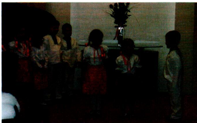
Deti z našej MŠ na vernisáži .