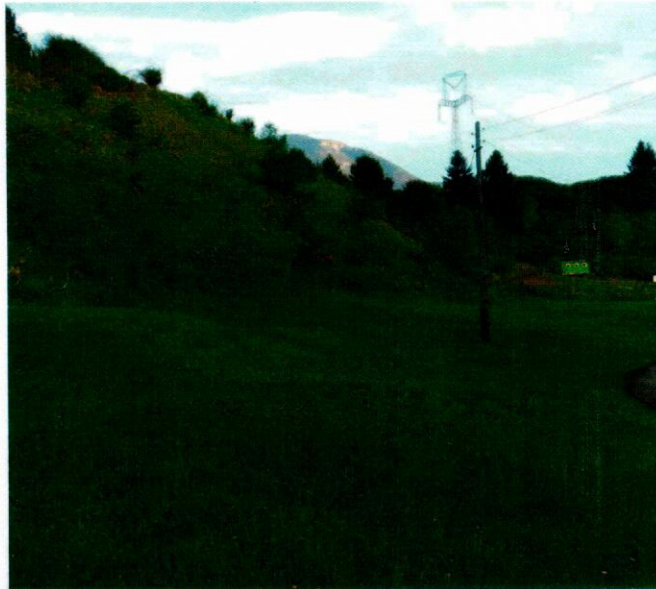
Čistejšie prostredie v okolí dediny – bez odpadkov je to krajšie.