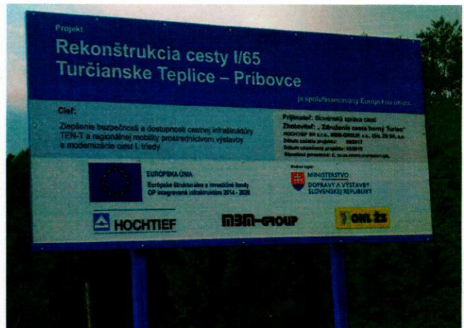
Na tabuli oznamujú koniec stavby na 02/2019. Uvidíme...