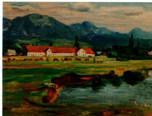
J. Vrťak: pohľad na družstevný dvor.