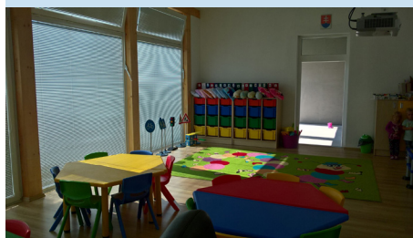
Záber z rozšírenej časti vynovenej materskej škôlky.