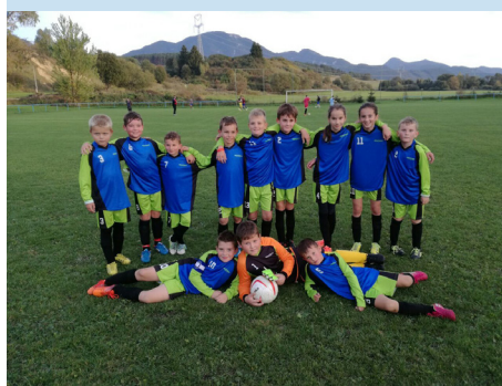
Naša prípravka v nových dresoch.