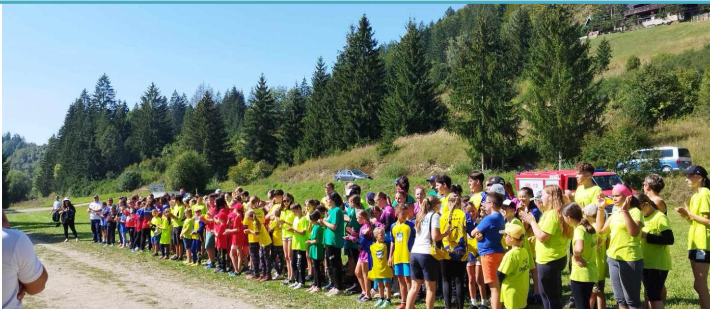
1. kolo branného preteku v Jasneskej doline, 9. september