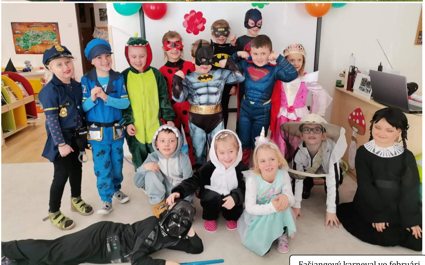
Fašiangový karneval vo februári