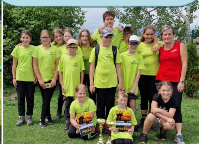
Memoriál v Žabokrekoch, dievčatá 2. a chlapci 3. miesto

Deti si viedli veľmi dobre, sú dobrý kolektív a majú na to, aby z nich vyrástli aktívni a dobrí dobrovoľní hasiči. Vďaka patrí celému kolektívu DHZ, rodičom i starostovi obce za pomoc a povzbudzovanie v celej lige.