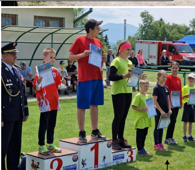
Okresná súťaž hry Plameň v Turčianskych Kľáčanoch, 3. miesto za útok s vodou, 17. jún