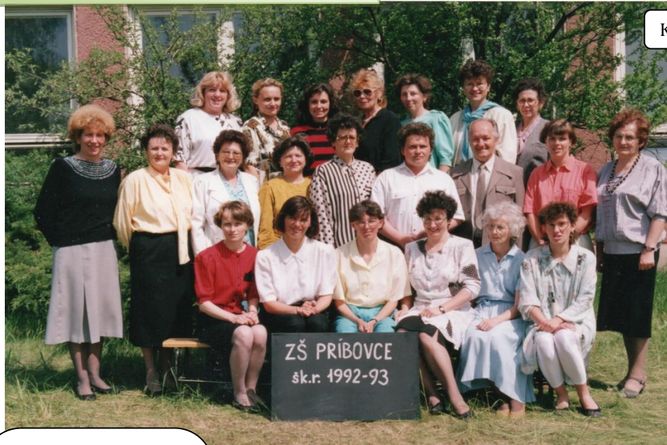
Kolektív učiteľ'ov školy

Pani učiteľka začala učiť v roku 1957 na Základnej škole v Rabči na Orave, kde dostala pridelenú umiestenku po skončení Pedagogickej školy v Turčianskych Tepliciach.